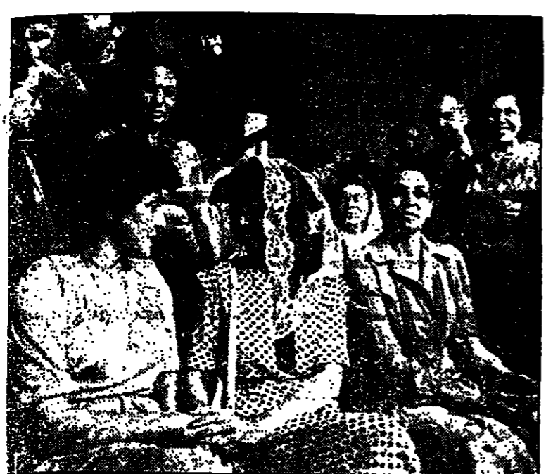
عقيلة رئيس الدولة السيدة اوفيرا ناسون في الكنيس اليهودي في شارع عتلي بك .